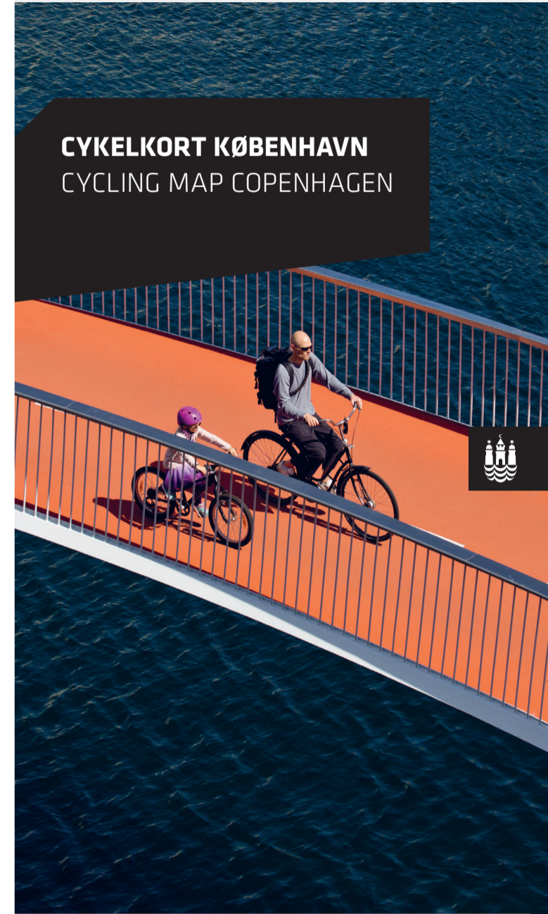
CYKELKORT KØBENHAVN CYCLING MAP COPENHAGEN

Du læse mere om hvor du kan få en cykel, muligheder for guidede ture, færdselsregler osv. på http://www.sticopenhagen.com/copenhagen/ You can read more on how to get a bicycle, possibilities for guided tours, traffic rules etc. at: http://www.sticopenhagen.com/copenhagen/ bike-city-copenhagen