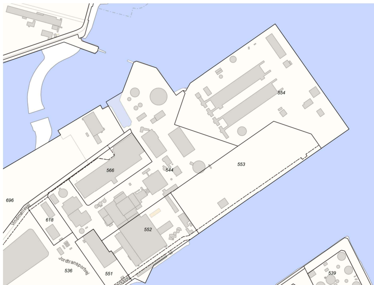
Figur 3: Matriklerne 544, 551, 552, 553, 554, 566 og 618