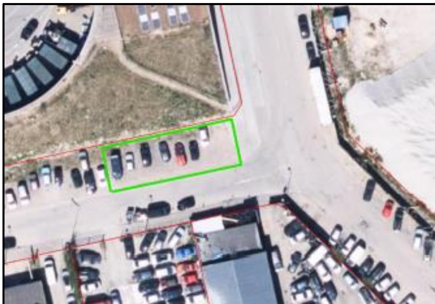
Areal til mellemoplag er markeret med grønt.