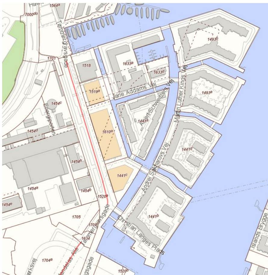
Figur 2: Projektområdet markeret med gul (1519a, 1610a, 1441c).

Projektet er beliggende på Nelson Mandelas Allé, matrikel nr. 1519a, 1610a og 1441c.