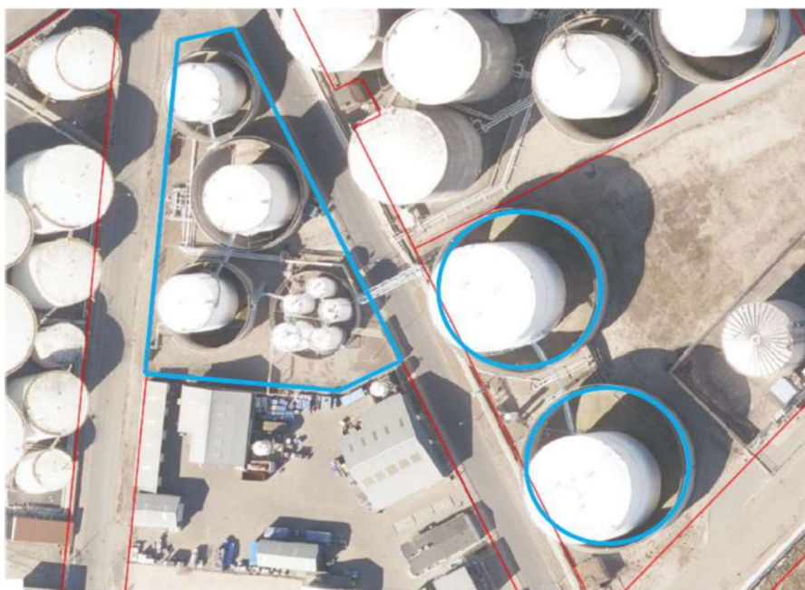
Figur 2: Projektområdet markeret med blå

Ansøgningen er indsendt iht. miljøvurderingslovens 1 , § 19 og Teknik- og Miljøforvaltningen vurderer, at projektet omhandler et projekt på miljøvurderingslovens bilag 2 pkt. Anlæg til bortskaffelse af affald (projekter, som ikke er omfattet af bilag 1).