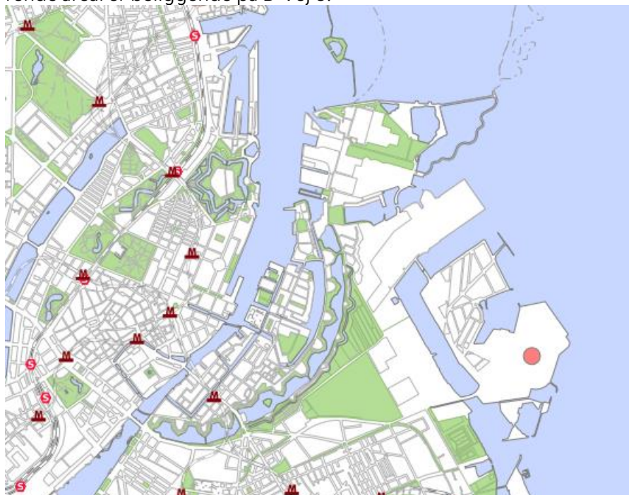
Figur 1: Område markeret med rød cirkel

Projektet er beliggende på adressen Y-Vej, 2300 København S, matrikelnummer matr. 639, Amagerbros Kvarter, København. Norreccos nuværende areal er beliggende på B-Vej 8.