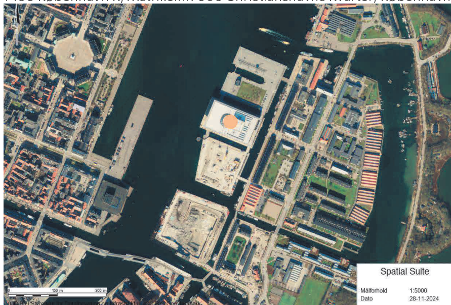
Figur 1: Projektområdet ved den orange cirkel

Projektet er beliggende på adressen Operaen, Ekvipagemestervej 10, 1438 København K, Matrikelnr. 656 Christianshavns Kvarter, København.