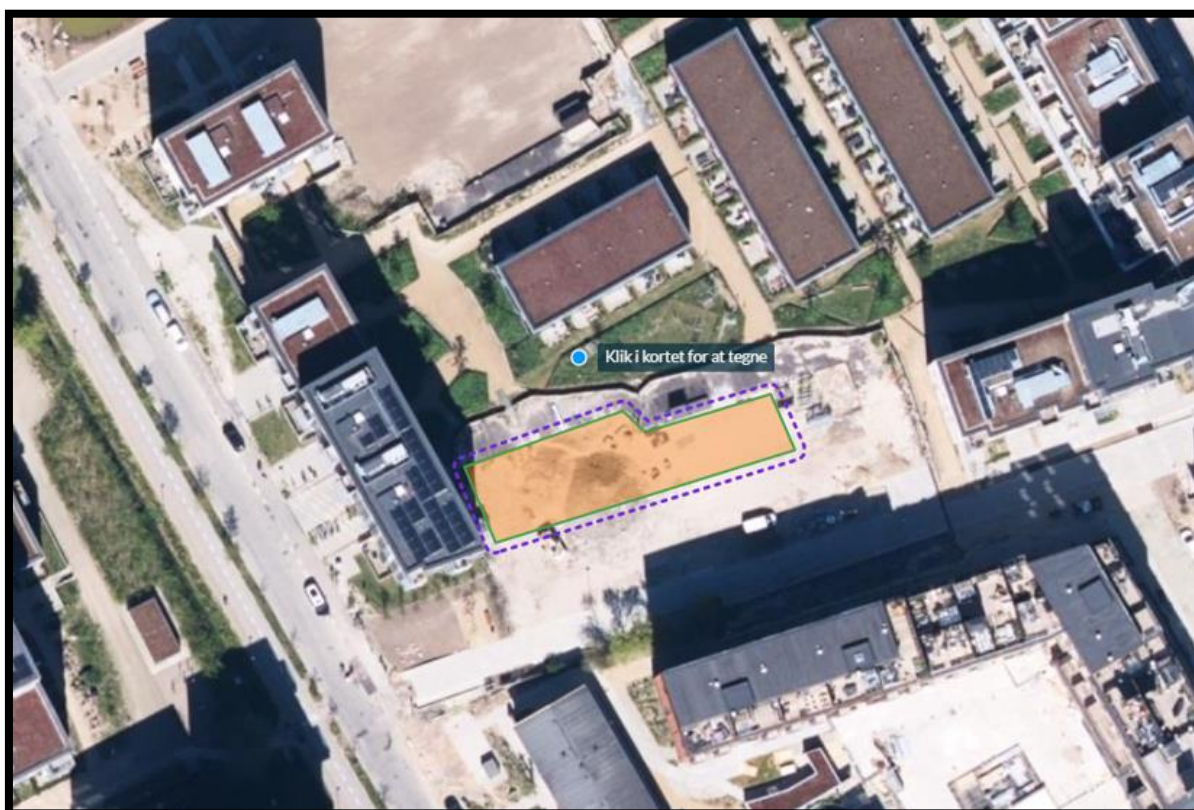
Figur 2 Projektets placering angivet med orange polygon og angivelse af det kommende byggeri placering nederst.