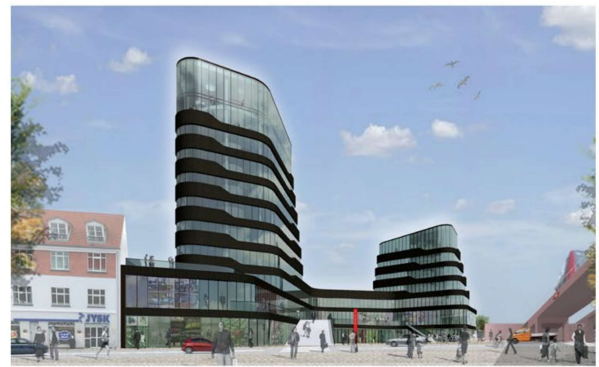
3D-illustration set fra Frode Jacobsens Plads.