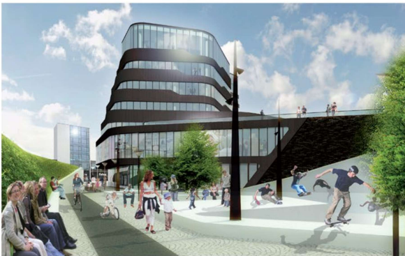
3D-illustration af forslag til fremtidigt opholdsareal ved S-togs