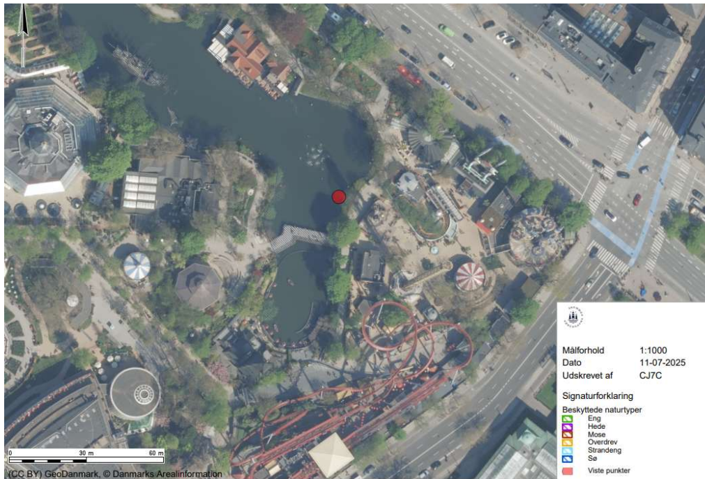
Figur 3 viser kort med Tivoli søen, som er defineret som en beskyttet naturtype. Med rød markering ses, hvor der etableres 3 stolper der skal bære forlystelsen.

Projektet kommer således til at ligge delvis ovenpå den nærmeste beskyttede naturtype, Tivolisøen, som er beskyttet sø. Der søges om dispensation fra naturbeskyttelseslovens § 3 til placeringen hos Københavns Kommune.