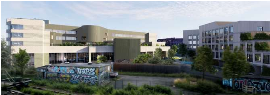
Figur 3. Visualisering, der viser et eksempel på et nybyggeri set fra nord i overensstemmelse med lokalplanen. Illustration Nordic Office of Architecture

Virksomheder og VVM Afgørelse om at anlæg og drift af svømmehal og botilbud, beliggende Lyngbyvej 97, Kbh. Ø ikke er VVM-pligtigt 4/10