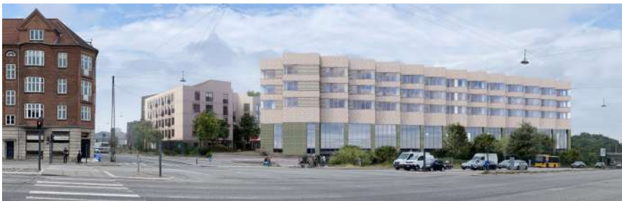
Figur 4. Visualisering, der viser et eksempel på et nybyggeri mod Lyngbyvej i overensstemmelse med lokalplanen. Illustration Nordic Office of Architecture.

Af ansøgningsmaterialet fremgår skyggediagram (fra lokalplanen), der viser at området er indrettet, så der ikke er væsentlig skyggepåvirkning fra projektet til naboejendomme, se nedenfor.