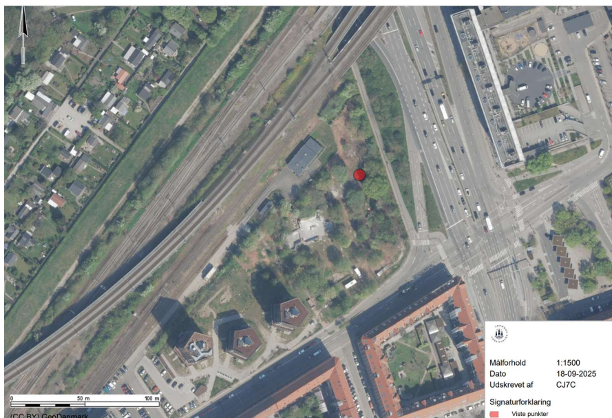
Figur 2: Viser projektområdet der fremstår overvejende ubebygget. Desuden viser kortet de nære omgivelser der primært er jernbane- og vejanlæg samt boligområder.

Projektområdet er mod øst omgivet af vejanlæg hhv. Lyngbyvej og Helsingørmotorvejen. Mod nord og vest er jernbaneanlæg. Mod syd boligområder, se figur 2.