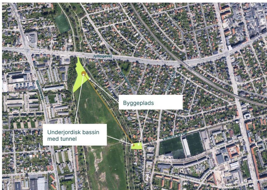
Figur 1: Kortet viser placering af hele projektet herunder bassinerne for DEN og KIL, Tunnellen "DET" og skakten ved DES. Tunnellen er vist med orange linje imellem DEN og DES. Kortet er redigeret fra et kort fra bilaget til Miljøkonsekvensrapporten.

Anlægsarbejdet med etablering af DEN vil berøre en lille del af den §3 beskyttede eng på Damhusengen (se Figur 2), hvorfor HOFOR med denne ansøgning søger om dispensation iht. Naturbeskyttelseslovens §63. Årsagen til at placeringen af bassinerne ikke kan være længere fra det §3 beskyttede område skyldes at bassinerne skal placeres strategisk i nærheden af de eksisterende udløbsbygværker for på den måde at håndtere så meget som muligt af det opspædede spildevand.