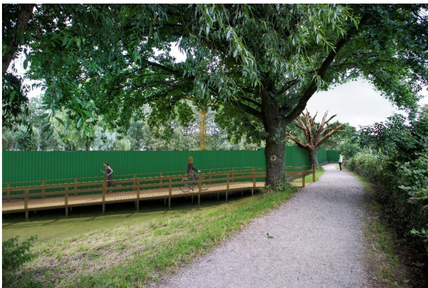
Figur 5: Visualisering af hvordan gangbroen kommer til at synes i området under udførelsesfasen. Der ses op mod fra Damhusengen og op mod Jyllingevej. Grundet distance fra broen til terræn forventes det nødvendigt på denne del af stisystemet, at der skal etableres en håndliste. På den resterende del af stisystemet forventes dette ikke at være nødvendigt. Gangbroen kommer til at være opstillet i hele anlægsfasen.

Det engareal, der inddrages, er ifølge en kortlægning fra 2022 en tør kultureng domineret af høje græsser og med ringe naturtilstand /1. Arealet bliver slået to gange årligt – forår og efterår. Omkring 200 m 2 af de 983 m 2 er permanent tætslået sti, og ellers bliver området primært anvendt til hundeluftning. Enge af denne type er generelt ikke sårbare overfor forstyrrelser, og reetablerer sig hurtigt. Byggepladsen vil blive anlagt ved, at topjorden afrømmes og gemmes i depot i nærområdet. Muldlaget vil efter dialog med Københavns Kommune blive anvendt til at retablere vegetationen efter anlægsarbejdet. Hvis det viser sig ikke at være muligt at opmagasinere mulden vil den blive bortskaffet og området vil efter aftale med Københavns Kommune blive reetableret når anlægsperioden er overstået. Det vil blive sikret, at der vil ske en reetablering med en type af jord, som giver bedst mulige betingelser for en reetablering af engområdet.