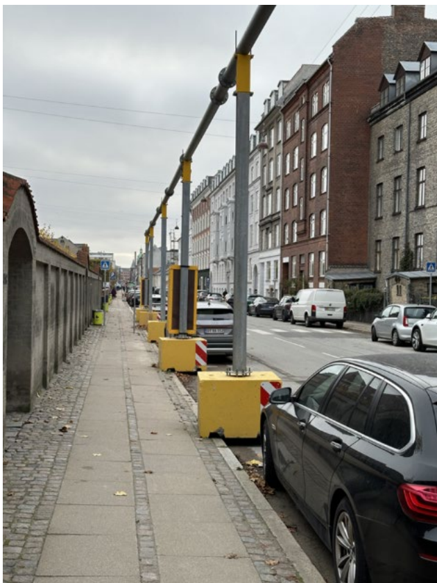
Figur 8: Eksempel på en hævnning af en ledning, hvor der sker grundvandssækning. Setup på Damhusengen kommer til at minde om ovenstående situation, men vælges endeligt af den udførende entreprenør.

Det overskydende grundvand, som ikke kan reinfiltres, vil blive ledt til kloakken og i tilfælde af at spildevandssystemet er nær overbelastning vil det oppumpede grundvand blive ledt til Harrestrup Å. Denne løsning er blevet valgt på baggrund af udførte analyser af vandkvaliteten i de borer, som er udført i forbindelse med forundersøgelserne af projektet og er valgt i samarbejde med Københavns Kommunes recipientmyndighed. Afledningen af det oppumpede grundvand forudsætter dog, at der meddeles en midlertidig udledningstilladelse.