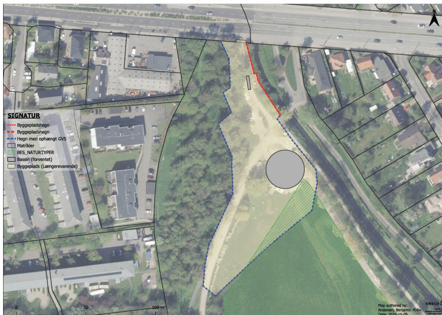
Figur 2: Kort over §3 beskyttet eng og placering af kommende byggeplads ved DEN (vist med stiplede rød linje). Placering af det kommende bassin er i randen af det §3 beskyttede område, men lige nøjagtigt uden for.