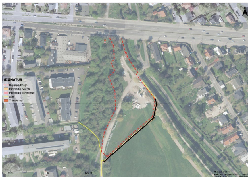
Figur 3: Kort over stisystemet, der løber langs byggepladsen ved DEN. Den sorte linje angiver det stisystem, som udføres på skruefundament. Stien, som er markeret med en tynd gul linje, er for gående og er eksisterende stisystemet og bliver ikke udført med skruefundament.