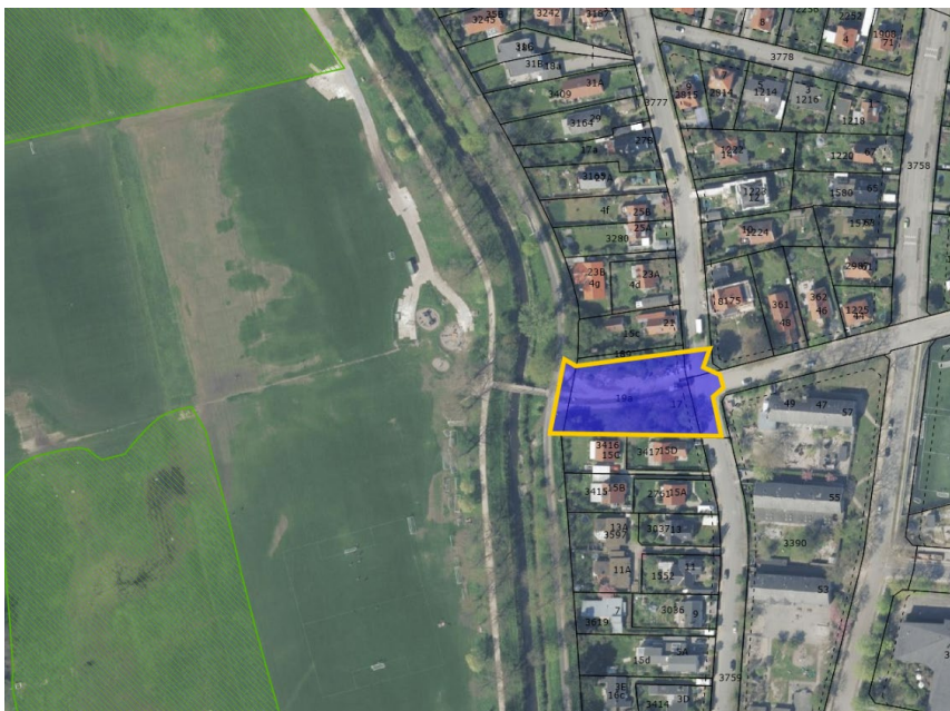
Figur 4: Kort over placering af byggeplads ved DES (forsøgt vist med blå firkant). Inden for området er der ikke noget §3 beskyttet eng og det er vurderet, at denne byggeplads ikke påvirker engområdet. Kortet er modificeret fra Miljøkonsekvensrapporten (figur 8-10) for at få det §3 beskyttede område indarbejdet.