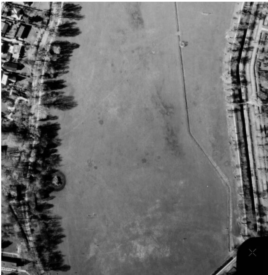
Figur 3 Luftfoto 1982. Også her ses spredte boldbaner med forholdsvis ensartet vegetation imellem, dog med flere fugtige partier især i den vestlige del.