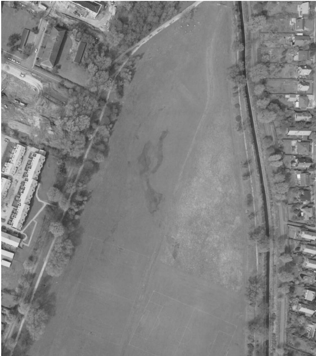
Figur 6 Luftfoto 1989. På billedet ses kortklippet vegetation med fugtige partier i den vestlige del af det nuværende § 3-område, men noget mere høj vegetation i den østlige del.