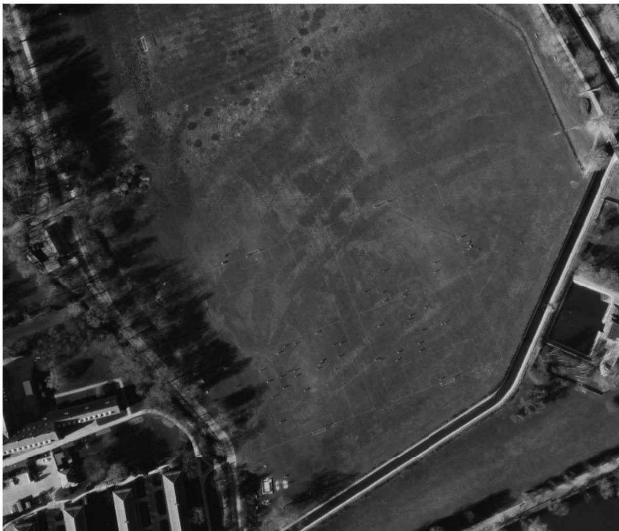
Figur 4 Luftfoto 1978. Det meste af den sydlige del af engen bruges som boldbaner. Billedet viser de optegnede baner med spillere på banen.

Billederne viser tydeligt, at store dele af den sydlige del af engen har været anvendt og plejet som boldbaner op igennem 70'erne og 80'erne samt til en vis grad stadig i 1995. Der kan derfor ikke have været engvegetation, som lever op til kravene for at være omfattet af NBL § 3 pr. 1. juli 1992.