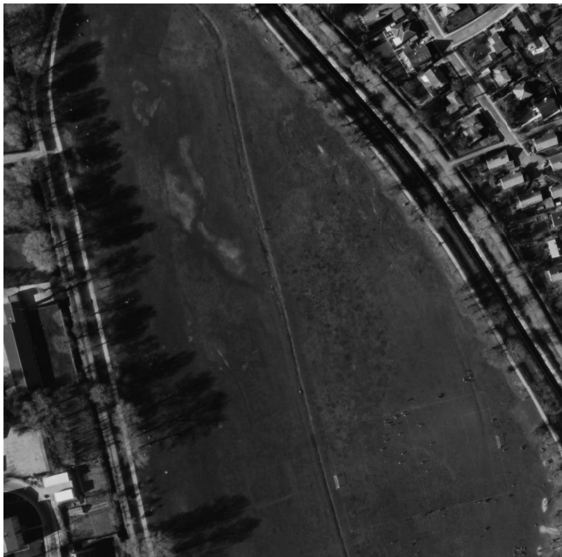
Figur 7 Luffoto 1978 af den nordlige del af engen. Der ses en boldbane i den sydlige del af billedet, men et noget mere varieret vegetationsbillede i den nordlige del, med fugtige partier.

Anvendelsen og plejen af den nordlige del af engen ser ud til at have varieret over tid, ligesom i den sydlige del. Der er dog på alle tre billeder høj vegetation i den østlige del og fugtige partier i den nordlige del. Det er ikke muligt at nå frem til en entydig konklusion om hvorvidt der har været eng på hele eller dele af det nordlige nuværende § 3-område i 1992. Da arealet først i 2012 blev kortlagt som § 3-område, og dengang blev beskrevet som værende i dårlig tilstand med ensformig vegetation, vurderes det alligevel at være usandsynligt, at der var engvegetation i 1992.