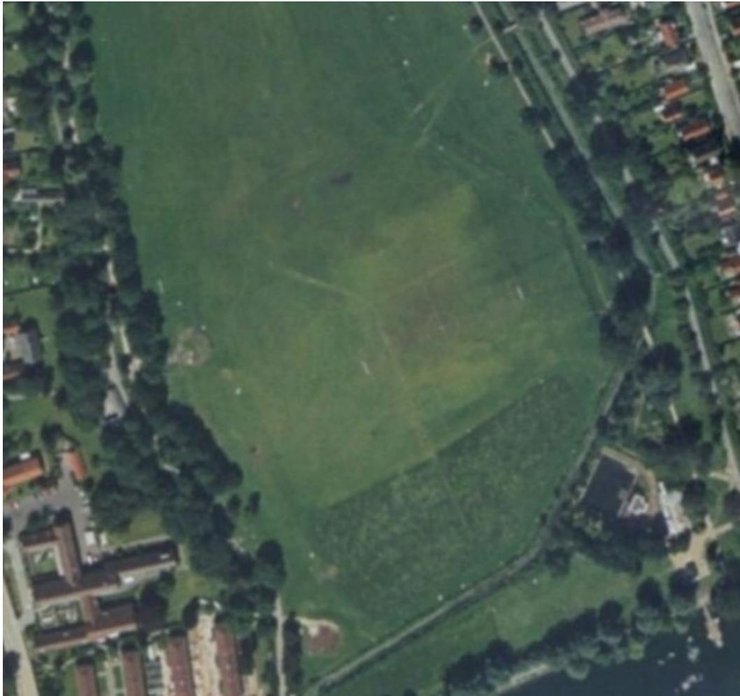
Figur 2 Luftfoto 1995. På den sydlige del af engen, kan der ses optegninger til en boldbane og generelt et meget monotont vegetationsbillede.