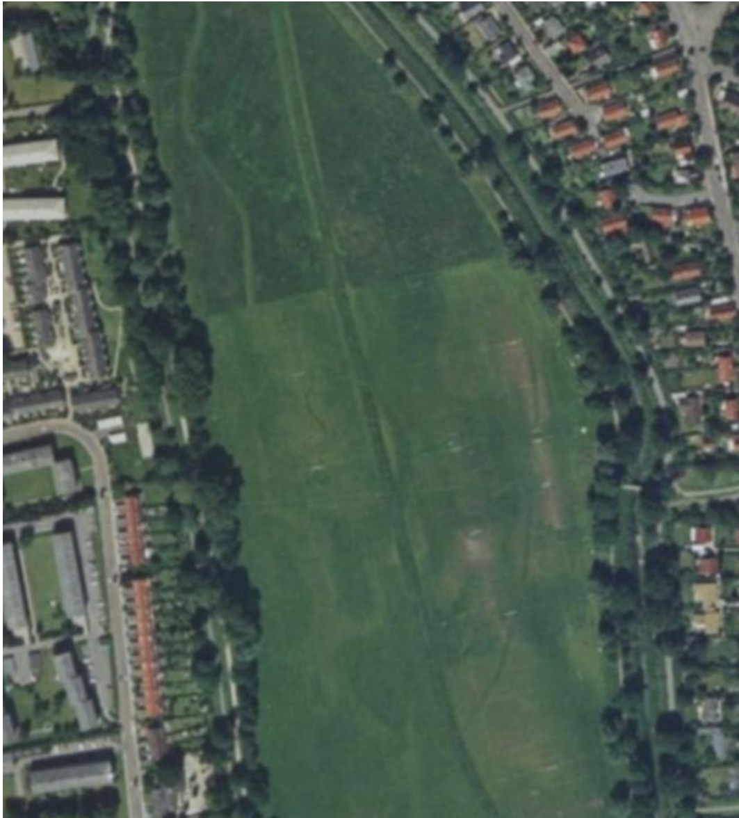
Figur 5 Luftfoto 1995. Også de centrale dele af engen bruges som boldbaner, hvorimod den nordlige del ses med mere vildtvoksende, dog ensartet vegetation. Billedet svarer her nogen lunde til det, vi ser i dag.