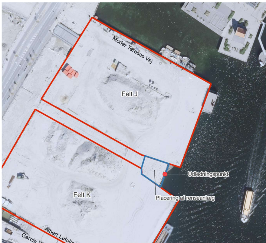
Figur 1. Oversigt over udledningens placering, placering af renseanlæg, samt byggefelt J som har matrikelnr. 1562.

Geo (CVR-nr. 59781812) har på vegne af 5E Byg A/S den 27. januar 2026 ansøgt om tilladelse til udledning af 100.000 m 3 grundvand og byggegrubevand til kanal ved Enghave Brygge i Københavns Havn i forbindelse med tørholdelse af byggegrube ved udgravning til kælder.