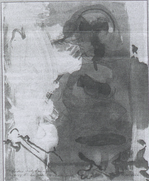
Henrik Have: "Kvinden med ovariepressen, 2006, akryl på litografisk prøvetryk, 47 x 36.

Lørdag den 7. juli, kl. 12:30 afholdes omvisning v. mag.art