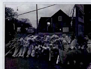
Der ligger masser af blomster foran Krudttønden på Østerbro efter terroranslaget.