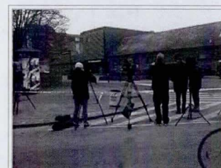
Pressefolk bag politiafspærringen foran Krudttønden den 15. februar 2015.