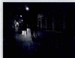
Politiafspærring på Købmagergade tre timer efter angrebet på Synagogen i Krystalgade.

Dansk Islamisk Råd har efter angrebet fordømt det og i en pressemeddelelse skrevet: "Alt tyder på, at terrorismens hænder har slået til i Danmarks hovedstad København og gået målrettet efter at ramme et kulturarrangement om ytringsfrihed, hvis våben blot har været holdninger, med en kriminel handling, som alle himmelske religioner og verdslige love tager afstand fra". [36]