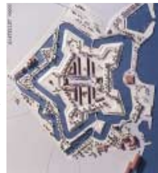
Modelfoto af Kastellets retablering.

I 1985 blev Frihavnen lukket og Frihavsbanen nedlagt. Derved blev det muligt at retablere kærnefæstningens volde og væsentlige dele af udenværkerne. I 1986 blev der nedsat en komité til retablering af Kastellets voldanlæg, med det formål at sikre en sammenhæng mellem restaurering af Kastellets bygninger og renovering af selve voldanlægget.