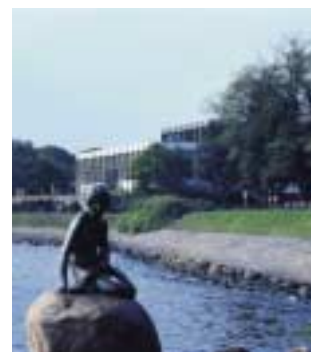
Langelinie med den Lille Havfrue.

Da Frihavnen og Frihavnsbanen blev anlagt omkring 1895 ændrede Langelinieområdet karakter. Hegnet ind til Nordre Frihavn skar 'linien' over lige nord for Islands Batteri, og Frihavnsbanen afskar Langelinie fra resten af Nordre Toldbod. Samtidig mistede Østerbro sin adgang til kysten og den gamle strandpromenade. Som kompensation for dette anlagde man en ny promenade på Frihavns ydermole, på taget over Langelinie kajens lange pakhus.