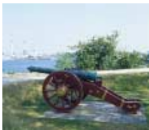
Kanon på Prinsessens Bastion.

De første fortegnelser over Kastellets skyts er fra 1670, hvor der var ikke færre end 94 stykker skyts på voldene, heraf de 54 på hovedvolden og 40 på udenværkerne.