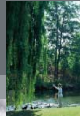
VEJ & PARK 1997

BYGGE- OG TEKNIKFORVALTNINGEN KASTELLET'S KOMMANDANTSKAB