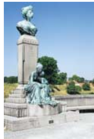
Prinsesse Marie med Kastellet i baggrunden.

Københavns Brandvæsen markerer hvert år Prinsessens fødselsdag ved monumentet