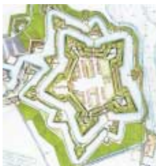
Kort af Kastellet 1754

Med udgangspunkt i det eksisterende anlæg gav Rüse sig i kast med opgaven og udformede i løbet af 1661 et projekt, hvor de tre bagvedliggende bastioner fra Skt. Annæ Kastel blev suppleret med yderligere to ud mod Øresund. Den flotte femtakkede