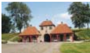
Norgesporten med Kastelets Historiske Samling.

Kastellet huser Det Kongelige Garnisonsbibliotek, blandt lånere kaldet KGB, samt to museer; Livjægermuseet og Kastelets Historiske Samling. Hvert år markeres Kastelets fødselsdag, d. 28. oktober, med en koncert, og der sættes sejl på Kastelmøllens vinger. Der