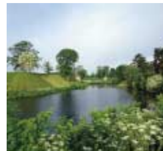
Prinsessens Bastion og Norgesporten.

Den vældige renæssancefæstning med de høje jordvolde, fremskudte bastioner og dybe vandgrave tjente som forsvarsværk frem til midten af 1800-tallet. Det indre femtakkede anlæg benyttes fortsat af Forsvaret og er samtidig verdens ældste, stadig fungerende kaserne. Dele af udenværkerne er forsvundet, men størstedelen med Smedelinien, den dobbelte grav og Langelinie indgår i den ring af grønne anlæg, der er anlagt på byens gamle volde. Kastellet og udenværker er, som resten af Københavns fæstningsring, fredet.