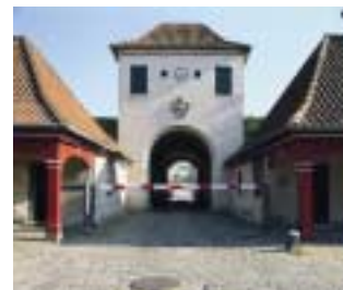
Kongeporten med uret fra Hovedvagten på Kgs. Nytorv.

Den fint udsmykkede Kongeport, der er udstyret med en buste af Frederik III og året 1663, er Kuppets hovedport. Her foregik al trafik til og fra byen. Norgesporten vendte oprindeligt ud mod åbent land, og her sparede man på udsmykningen. Begge porte er opført i klassisk nederlandsk barokstil. Lige inden for portene ligger to vagtbygninger fra samme periode, og udenfor var der oprindeligt ved begge porte to fremskudte portbygninger, caponierer, hvorfra man kunne beskyde fjenden. I slutningen af 1800-tallet blev caponiererne foran Norgesporten fjernet. I Kongeportens indre facade kan man se uret og de to klokker fra Københavns gamle hovedvagt på Kgs. Nytorv. De blev opsat i 1874, da 'vagten' flyttedes til Kuppet. Fra hovedvagtens ur stammer udtrykket 'under uret'.