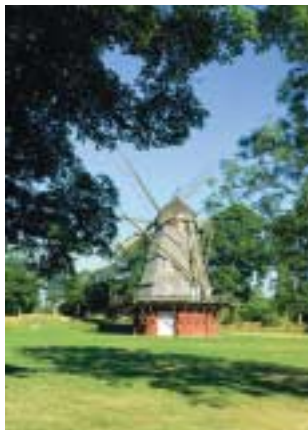
Kastelsmøllen på Kongens Bastion.

Næsten hver eneste bastion fra Kalvebod til Kastelet har haft sin mølle, 13 i alt. Med yderligere tre på Christianshavns Vold var der år 1800 tilsammen 16 voldmøller. Et imponerende syn. I dag er Kastelets hollandske vindmølle fra 1847 den eneste af de gamle voldmøller, som er intakt. Kastelets første mølle fra 1718 var en stubmølle, der imidlertid bukkede under for en storm i 1846. Den nye vindmølle blev opført på Kongens Bastion året efter, og leverede mel til Kastelets bageovne helt frem til 1908.