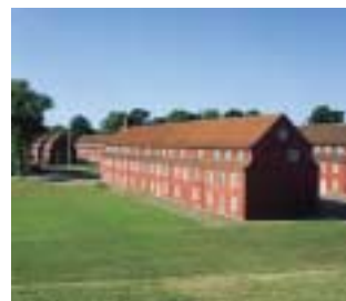
Stokkene set fra Prinsessens Bastion.

I 1768 blev alle stokkene udstyret med et gennemgående mansardtag. Ved restaurering efter 2. Verdenskrig fjernede man de fleste skorstene. Det oprindelige tagprofil kan i dag kun ses i den ene ende af Artilleristokken på gårdsiden, hvor der er indrettet en besøgstue; Vaaningen.