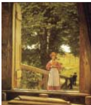
Købkes portræt af hans søster på vej op til magasinet.