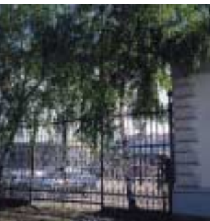
Gennem disse porte gik københavnere før Fribanen kom ud til Langelinie

I 1893 blev Lystbådehavnen anlagt ved Langelinie, og allerede i 1884 opførte Dansk Forening for Lystsejlad den første Langeliniepavillon på Pinnebergs Reduit. Pavillonen var et yndet morskabssted, særlig efter 1895, hvor adgangsbegrænsningen blev fjernet da Københavns Kommune overtog brugsretten til Langelinie.