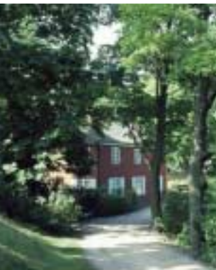
Smedelinien og den ene af de gamle smedjer.

Udenværket fik navn efter en smedjebygning på Falsters Contregarde. Den nordlige del af Smedelinien forsvandt ved anlæggelsen af Frihavnen og Kystbanen, men resten er i dag en af Københavns mest elskede promenader, gemt væk fra trafikken bag de lave voldes frodige bevoksning, og med udsigt til Kastellet, voldgraven og den Svenske Kirke.