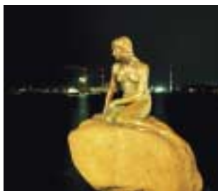
Den Lille Havfrue i aftenlys.

Den Lille Havfrue, Danmarks mest berømte statue, er i virkeligheden almindelig legemsstørrelse. Hun blev skabt af billedhuggeren Edvard Eriksen på bestilling af brygger Carl Jacobsen.