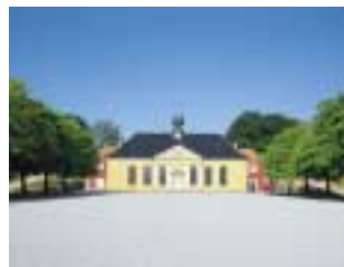
Kastelskirken; bagved skimtes de røde fløje af Arresthuset.

I 1725 opførtes der et arresthus lige bag kirken. I den fælles mur er en række huller, der havde det meget enkle formål at fangerne på den måde kunne nyde godt af gudstjenestens opdragende virkning, uden at den øvrige menighed kom i kontakt med dem. En hidtil uset og fortsat unik arkitektonisk konstellation.