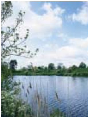
Kig fra Langelinie til Kastelet.

De fleste oplever nok primært Kastelet og udenværker, som en sammenhængende oase i byen. Københavnerne bruger hele området som én stor park: Går tur, lufter hunde og nyder solopgangen over havnen.