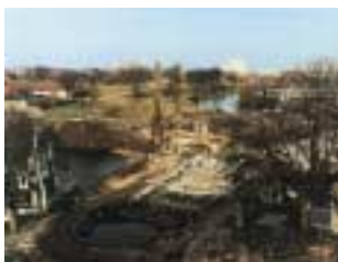
Retablering af Grevens Bastion.

omkring Grevens Bastion, har Forsvarsministeriet finansieret, at Gefionbroen drejes 37° ud mod Nordre Toldbod, og at Gefionspringvandet afsluttes ud mod voldgraven af en mur. Samtidigt har Københavns Kommune renoveret Langelinieanlægget og Churchillparken, så parkområderne og adgangsforhold tilpasses det genskabte Kastel.