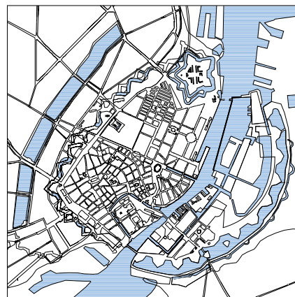
Københavns befæstning ca. 1890, efter sløjfningen af voldene.

Bygningerne tjente en række praktiske formål, men var opført uden sans for stedets ånd. Efter 1945 flyttede størstedelen af kasernefunktionerne uden for København. Senere blev de fleste bygninger fra slutningen af 1800-tallet nedrevet.