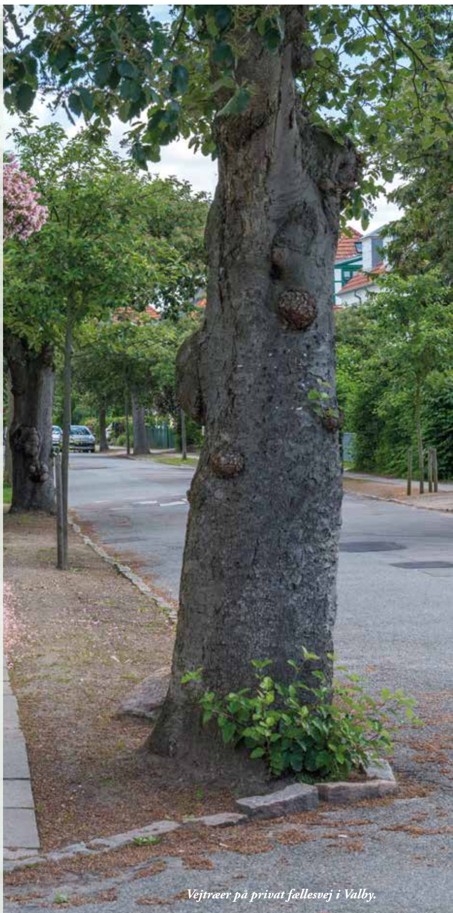
Vejtræer på privat fællesvej i Valby.

Vær opmærksomme på, at vejtræet får nok åben jordoverflade og eventuelt et rodvenligt bærelag. Regn med, at der skal graves ca. 10 kubikmeter jord op, som skal erstattes af god plantejord. Husk at sikre jer, at der er ordentligt drænet omkring hullet, så træet ikke drukner. Desuden skal man sikre sig, at træet får vand nok i tørkeperioder. Der skal ydermere være en kronfrihøjde på 2,8 meter over fortov og cykelsti og 4,5 meter over vejen.