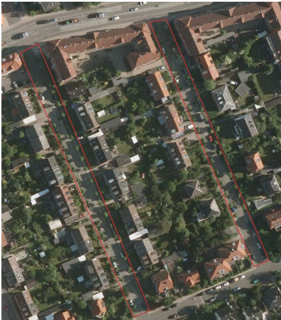
Kongedybs Allé og Provstens Allé: