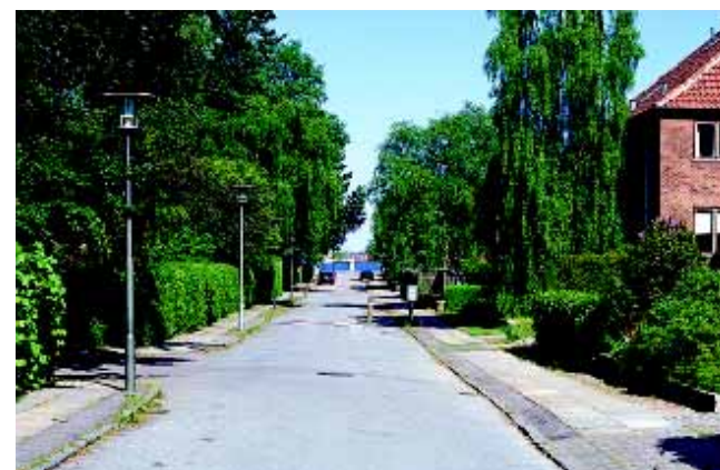
Fra villakvarteret i nordøst er der adgang til og udsyn over Øresund, her via Østerled.