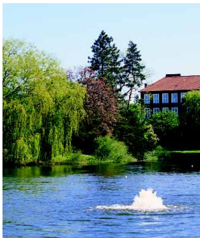
Kildevældsparken ligger i kanten af det tætbyggede område som et af de små, men vigtige grønne åndehuller.

De øvrige gader i bydelen er præget af de enkelte områ-