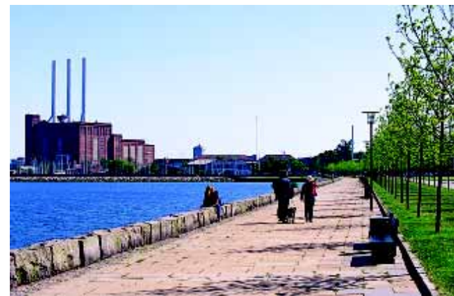
Fra Strandpromenaden ses Svanemøllenværket, beliggende i nabobydelen, som et markant vartegn.