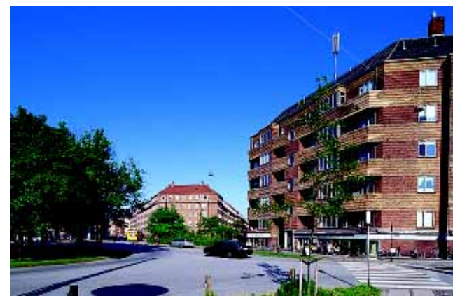
Skt. Kjelds Plads ligger centralt i det tætbebyggede område. Pladsens potentiale er ikke udnyttet fuldt ud, bl.a. mangler afgrænsning mod syd-vest.