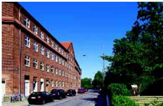
Det tætbebyggede område syd for jernbanen er de fleste steder klart afgrænset af præcise bygningsfronter som her ved Borgervænget.