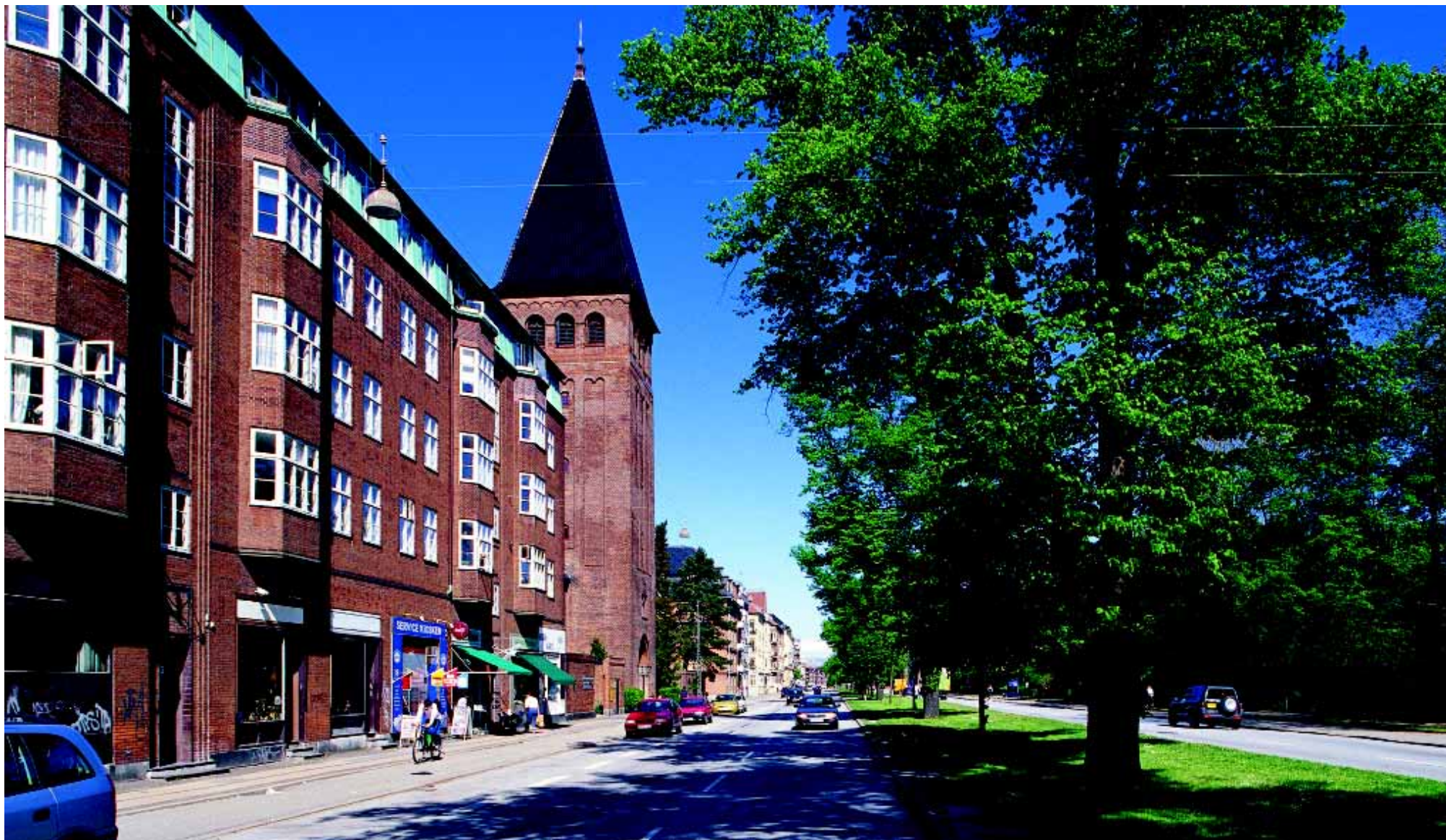
Jagtvej danner grænsen mellem Ydre og Indre Østerbro og har med sin træplantning et markant, boulevardagtigt præg.

Udsigten over bugten og Sundet må derfor fastholdes. Og med Strandpromenade, lystbådehavn og græsarealer rummer stedet helt enestående kvaliteter og muligheder som må plejes og understøttes i videst muligt omfang. Af mindre, grønne områder er Kildevældsparken og Emdrup Søpark de væsentligste.