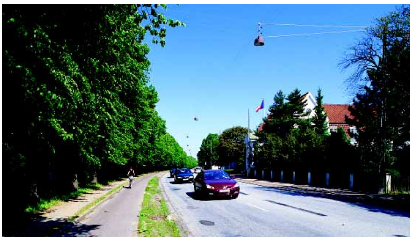
Ryvangs Allé der løber langs jernbanen i det nordøstlige område danner en markant afgrænsning af Ryvangens villaområde.

Vartegn og sigtelinier. Der findes kun få store markante bygningsværker i bydelen. Vanførefondens Hus ved Hans Knudsens Plads må betragtes som bydelens mest markante vartegn. Gasbeholderen fra det tidligere nedlagt Østre Gasværk er et vartegn af special betydning for bydelen. Den markerer sig især flot i området efter at der er etableret boldbaner på den østligste del af Gasværksgrunden.