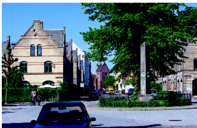
Den homogene byggeforeningsbebyggelse omkring Kildevældsgade danner med sin beskedne skala en lille by i byen med et centralt torv, og med Kildevældskirken som vartegn.