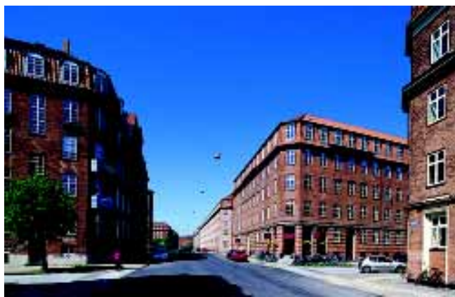
Tåsingegade har et fint rumligt forløb, og er en af diagonalgaderne, der stråler ud fra Skt Kjelds Plads.