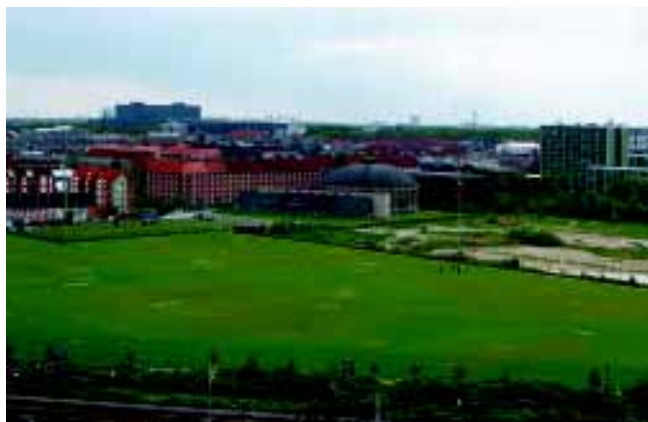
Gasbeholderen fra det tidligere Østre Gasværk er et vartegn af særlig betydning for bydelen. De ubebyggede gasværksarealer giver bydelen rekreative muligheder

Bebyggelsen. I bydelens sydlige delområde, mellem banen og Fælledparken, er bybilledet præget af en tæt karréstruktur med boliger opført i storkarreer. Flere bebyggelser har høj arkitektonisk værdi, f.eks. Solgården ved Ourøgade. De fleste er bygget senere end karreerne på Indre Østerbro og har gennemgående en højere boligstandard.