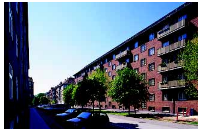
Den tætte karréstruktur i det sydlige delområde markerer sig tydeligt med boliger opført i storkarreer - her i Langøgade.

De enkelte delområders særpræg er af væsentlig betydning for bydelens nære miljøer og bør fastholdes i den videre planlægning.