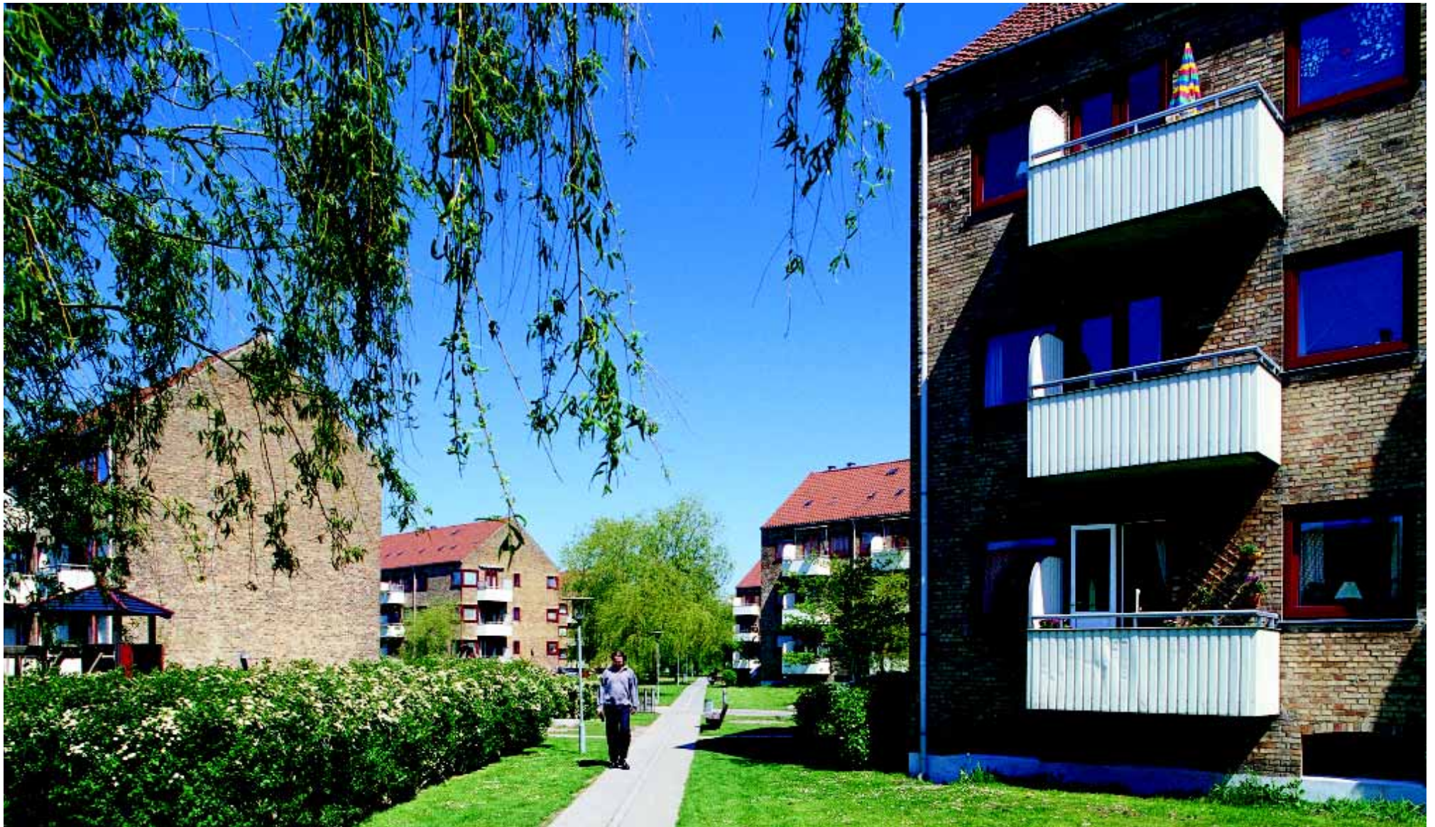
Ryparkens karakteristiske stokbebyggelse opført i 1930'erne er en smukt proportioneret bebyggelse med en frodig grøn parkkarakter.

Trafikarealerne. Jernbanerne - Kystbanen, Ringbanen og Farumbanen - deler bydelen i fire dele og danner desuden grænse mod Bispebjerg. Øst for Østerbrogade er banearialet bredt og danner derfor en stærk fysisk adskillelse mellem de tæt bebyggede områder og Svanemøllebugten.